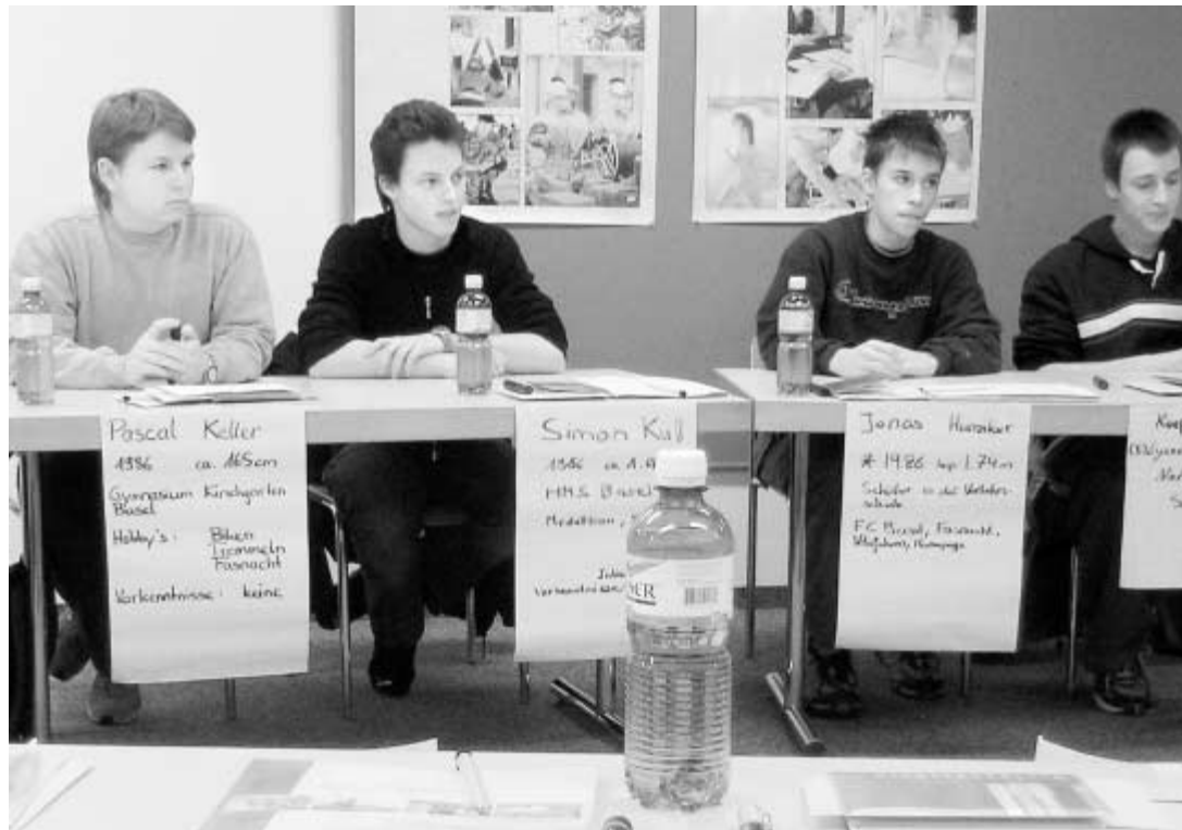
Rekruten. Aufmerksam hören sie zu. Heute wird von ihnen erwartet, dass sie sich für eine Dienstform entscheiden – und am Ende des Tages wissen, wann sie zur RS antreten wollen.

Die Rekrutierung der Stellungspflichtigen wurde bereits vor Einführung der neuen Schweizer Armee neu aufgegleist: Der neue Rekrutierungsprozess dauert nun mehrere Tage. Zwei oder drei davon verbringen die Rekruten im Aushebungszentrum Windisch (AG), wo sie sportlichen Prüfungen sowie eingehenden medizinischen und psychologischen Tests unterzogen werden.