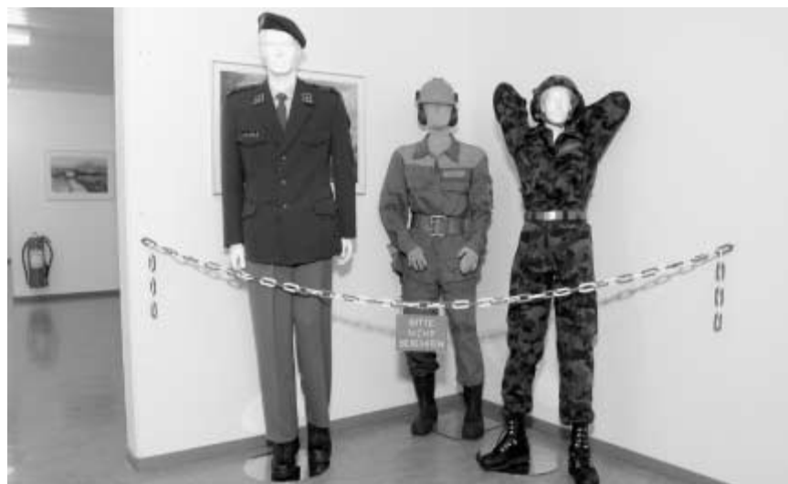
Uniformen. Auch die Uniformen, eine davon werden die Rekruten künftig tragen, können am Orientierungstag besichtigt werden.