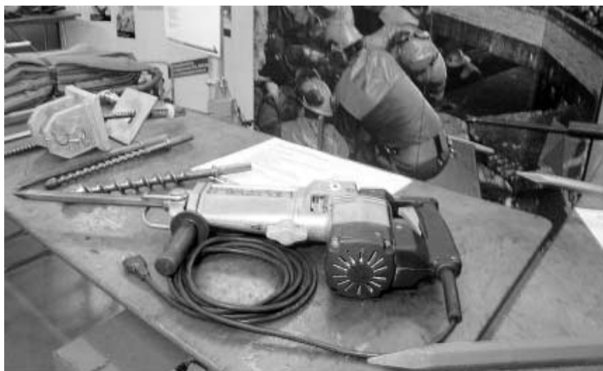
Werkzeuge. Am Nachmittag werden den Rekruten Werkzeuge, die man bei Armee und Zivilschutz braucht, vorgestellt.

Am Nachmittag werden die Rekruten dann mit der Ausrüstung verschiedener Truppengattungen in Zivilschutz und Militär vertraut gemacht. Danach werden sie sorgfältig über ihre Rechte und Pflichten aufgeklärt. Ziel der Übung ist es, dass am Abend jeder genau weiss, wo er seinen Platz im Militär oder Zivilschutz sieht. Gleichzeitig sollte der Rekrut dann auch wissen, wann er seinen Dienst leisten möchte. Vom zweiten Faktor hängt es ab, wann genau der Rekrut nach Windisch zur mehrtägigen Aushebung nach neuem Konzept aufgebeten wird.