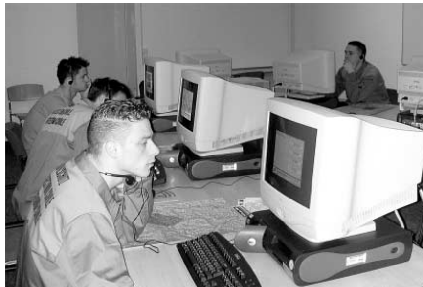
Auszubildende am Computer. Gerade im Bereich der Kartenlehre werden in der Ausbildung modernste EDV-Mittel eingesetzt.

Das Jahr 2004 bringt dem Zivilschutz einige Weichenstellungen – Weichenstellungen, welche die Dienstleistenden direkt betreffen.