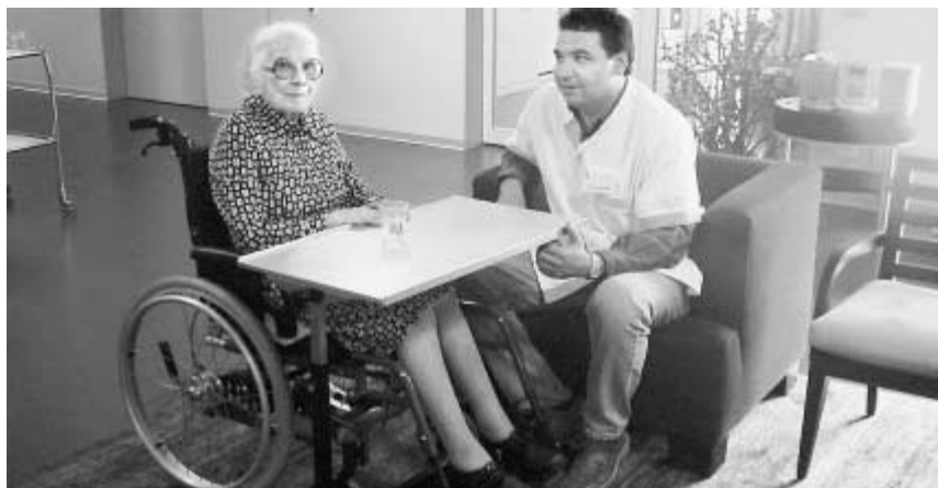
Auch Betreuung gehört dazu. Schon am ersten Tag ihres Praktikums werden die Kursteilnehmer von Fachpersonal in die Bereiche Pflege und Betreuung eingeführt.

zum Leutnant. Reto Scacchi, der Ausbildungschef des Basler Zivilschutzes, beurteilt die Neuerungen positiv: «Wir werden über eine effizientere, tiefer gehende Ausbildung verfügen.» Scacchi betont, dass man sich damit auch der zivilen Ausbildung annähert, sich also verstärkt auf methodisch-didaktische Elemente konzentriert, Prüfungen und Kreditpunkte-System einführt. «Die Bereitschaft, etwas zu leisten, ist da, wenn ein Sinn darin erkannt wird», sagt Reto Scacchi, «und auch eine Möglichkeit, das Gelernte im privaten Bereich anzuwenden.»